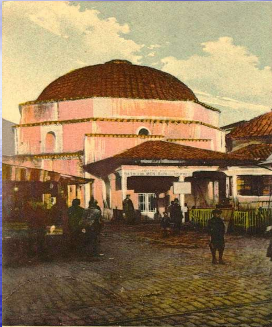
12. - SALONIQUE - Bains Turcs SALONICA. - Turkish Bath